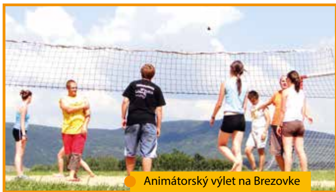
Animátorský výlet na Brezovke

na Poštárke. O tom ste si mohli prečítať viac v osobitnom článku.