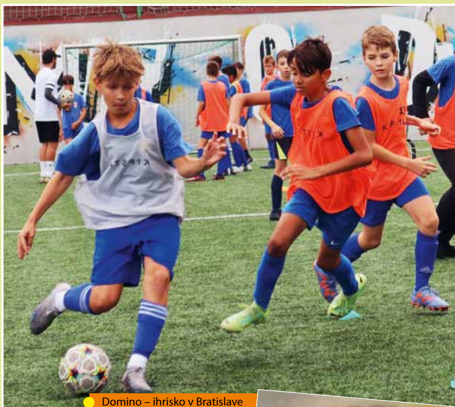
● Domino – ihrisko v Bratislave

Slávime Rok vďačnosti, počas ktorého budeme ďakovať za 100-ročnú prítomnosť saleziánov na Slovensku (1924 – 2024) a v duchu hesla „Spokornou vďačnosťou dávam ďalej, čo som dostal“ pozývame k znovuoživeniu charizmy dona Bosca na Slovensku.