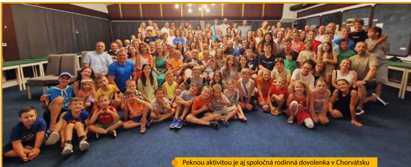
Peknou aktivitou je aj spoločná rodinná dovolenka v Chorvátsku

rodiny s deťmi, výlety, pomoc pri zabezpečovaní duchovných cvičení, obnovách pre mladých, ale aj tam, kde treba priložiť chlapeckú alebo ženskú ruku k dielu – upratovanie na chatách, v kostoloch a podobne.