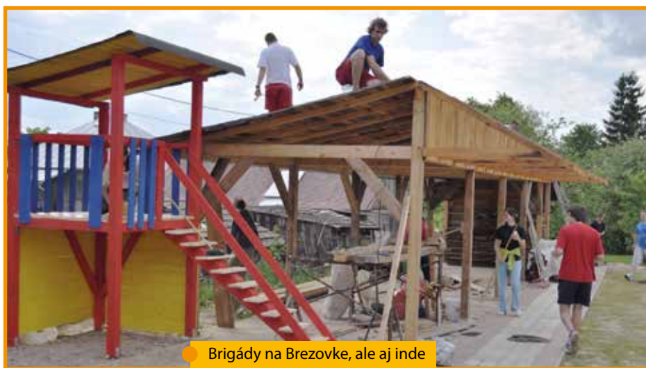
Brigády na Brezovke, ale aj inde