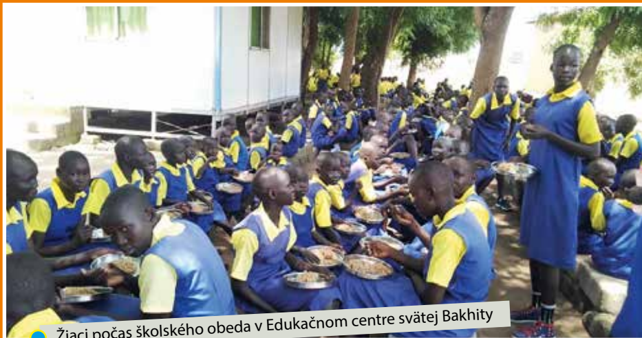
Žiaci počas školského obeda v Edukačnom centre svätej Bakhity

počas obedov či iných celoškolských spoločných aktivít vybudovaním školskej haly, ktorá by dokázala chrániť našich žiakov pred silným slnkom a v období dažďov im poskytla útočisko.“