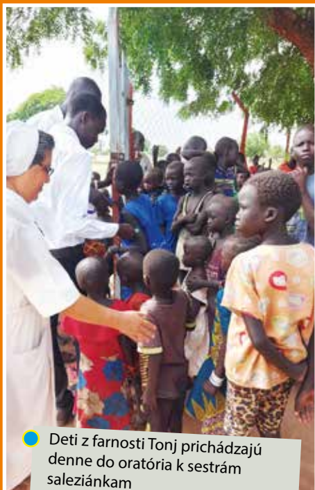
Deti z farnosti Tonj prichádzajú denne do oratória k sestram saleziánkam

Sestry saleziánky poskytujú vzdelanie deťom v materskej, základnej a strednej škole. Zároveň sa špeciálne venujú miestnym dievčatám, ktoré nedostali možnosť chodiť do školy v ranom detstve. Pre ne založili odbornú dievčenskú školu, kde sa okrem čítania, písania či počítania venujú niektorému z remesiel, aby sa dokázali užiť aj sami. Sestry saleziánky zabezpečujú všetkým svojim študentom pravidelný školský obed, ktorý je často jediným jedlom týchto detí. Momentálne však škole chýba školská jedáleň a deti sa stravujú na prašnej zemi pod stromami, ktoré ich aspoň čiastočne chránia pred spaľujúcim slnkom. Cieľom tohtoročnej zbierky TEHLIČKA 2024 je zlepšenie podmienok vzdelávania vybudovaním multifunkčnej školskej haly,