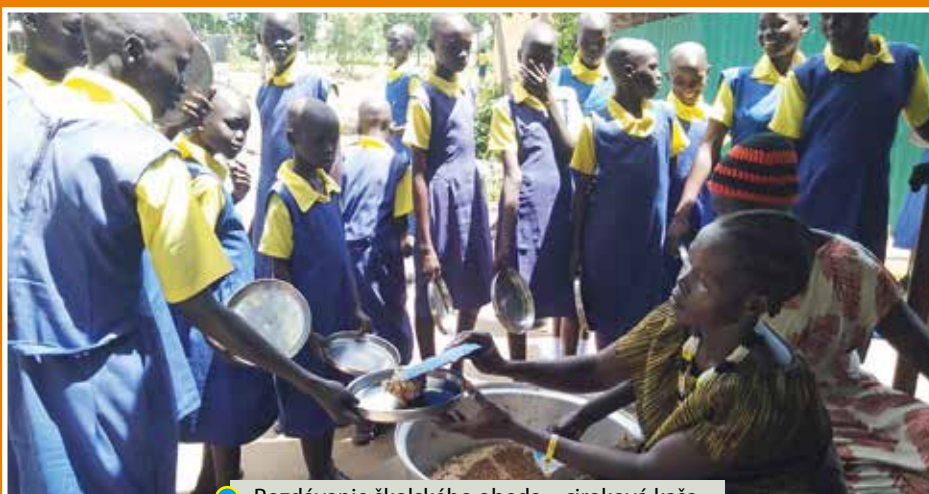
Rozdávanie školského obeda – ciroková kaša