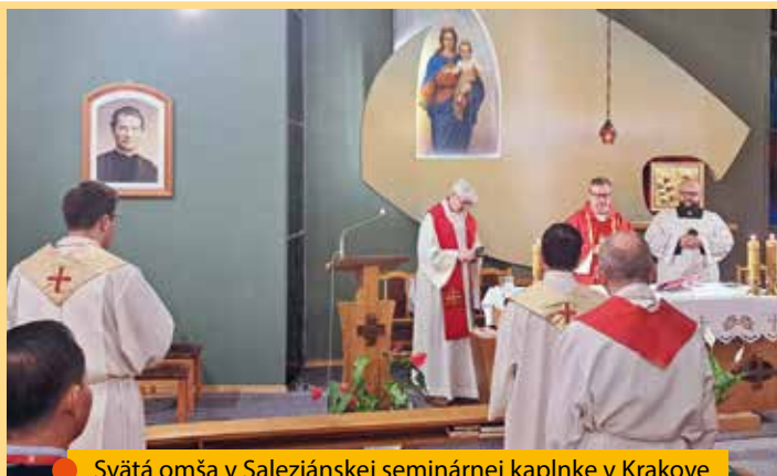
● Svätá omša v Saleziánskej seminárnej kaplnke v Krakove

saleziánsku rodinu. Hovorilo sa o úlohe provinciálnej delegátky pre saleziánsku rodinu a o situácii v provinciách.