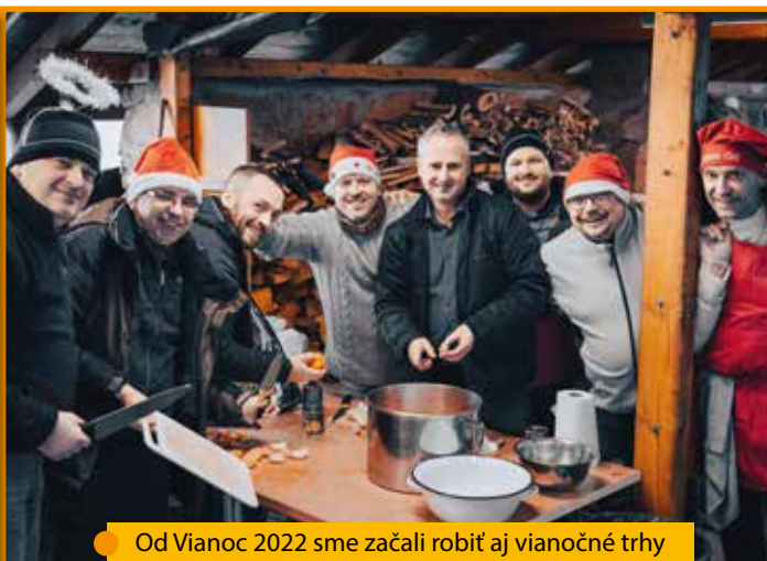
Od Vianoc 2022 sme začali robiť aj vianočné trhy