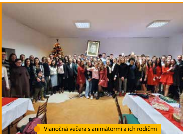
Vianočná večera s animátormi a ich rodičmi

Projekt je to náročný a oceníme každú pomoc. Viac o tomto projekte sa dozviete na stránke www.novabrezovka.sk . Ďalšie informácie o živote saleziánskeho diela v Bardejove môžete nájsť na našom webe www.pobavi.sk . Pre tých, čo sa nad tým niekedy zamýšľali, je to skratka PO-štárkaBA-rdejovVI-nbarg.