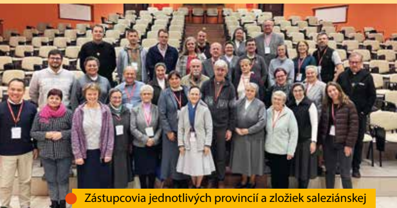
● Zástupcovia jednotlivých provincií a zložiek saleziánskej rodiny na stretnutí v Krakove

a priateľov dona Bosca (ExDB) a Združenie exallievov a exallievov FMA (ExFMA); Dobrovoľníčky dona Bosca (VDB); Misijná komunita dona Bosca (CMB) a Kontemplatívna fraternita Márie z Nazareta