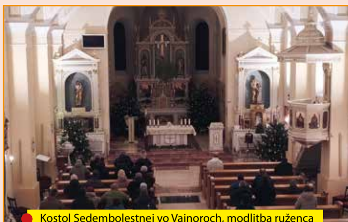
Kostol Sedembolestnej vo Vajnoroach, modlitba ruženca