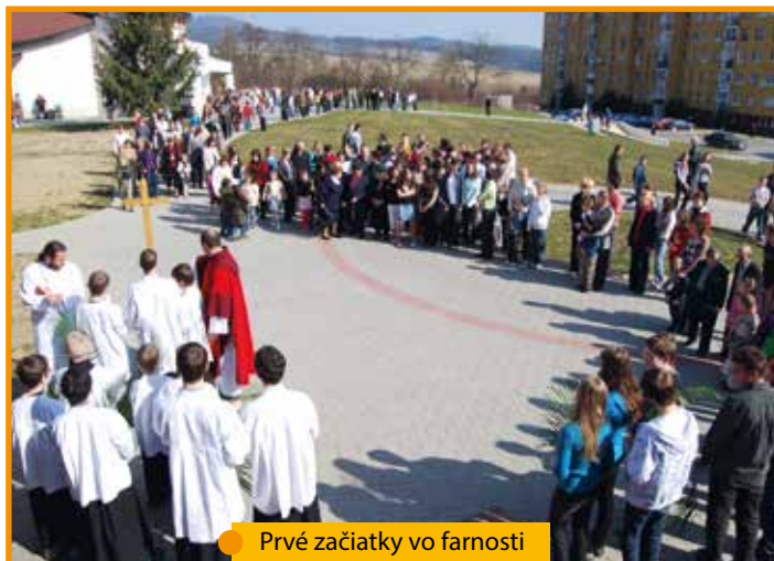
Prvé začiatky vo farnosti