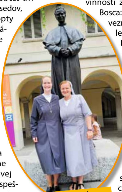
Pán Boh nám v posledných rokoch požehnal aj dve sestry FMA z Bardejova

Od roku 1995 pôsobí pri saleziánskom stredisku aj stredisko saleziánov spolupracovníkov, ktorých počet postupne rastie. V auguste 2018 bola založená skupina exallievov ako ďalšia zložka saleziánskej rodiny. Obe tieto laické hnutia pôsobia popri sebe a vykrývajú veľké pole aktivít pri organizovaní letných táborov – prímestské aj pobytové pre