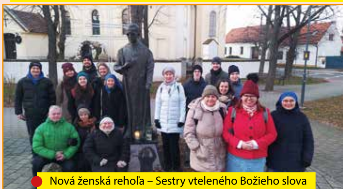
Nová ženská rehoľa – Sestry vteleného Božieho slova (Verbo incarnato) na púti