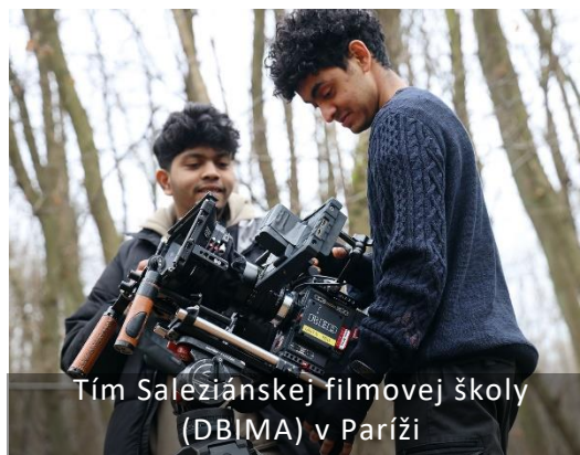
Tím Saleziánskej filmovej školy (DBIMA) v Paríži

Náš cieľ v DBIMA presahuje rámec produkcie vysokokvalitných videí; poverujeme mladých ľudí úlohami vytvárať obsah pre samotných mladých. S túžbou v našom poslaní vstúpiť do kresťanských hodnôt bez ohľadu na náboženské pozadie zapájame študentov do iniciatív ako CaglieroLIFE. Tu sa ponoria do mediálnej práce, pričom filmovú tvorbu využívajú ako prostriedok na skúmanie a vyjadrenie morálnych a etických princípov. Prostredníctvom tohto projektu študenti vytvárajú krátke filmy inšpirované nápadmi z Misijného sektora, čím podporujú osobný rast, introspekciu a zlepšovanie zručností v rámci misijného prístupu k mediálnemu vzdelávaniu.