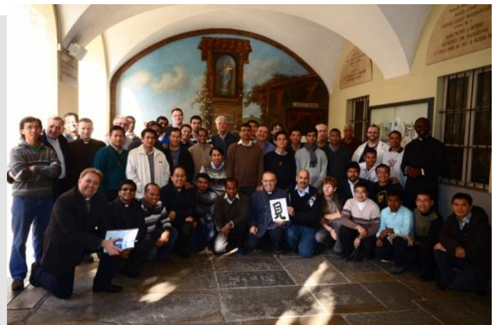
Stretnutie 58-mich misionárov v Európe na Valdoccu (31.10.-3.11. 2013)

Saleziánski misionári v Európe v súčasnosti pracujú v Albánsku, Azerbajdžane, Belgicku, Bulharsku, Francúzsku, Holandsku, Írsku, Taliansku, Litve, Maďarsku, Rakúsku, Veľkej Británii a Ukrajine.